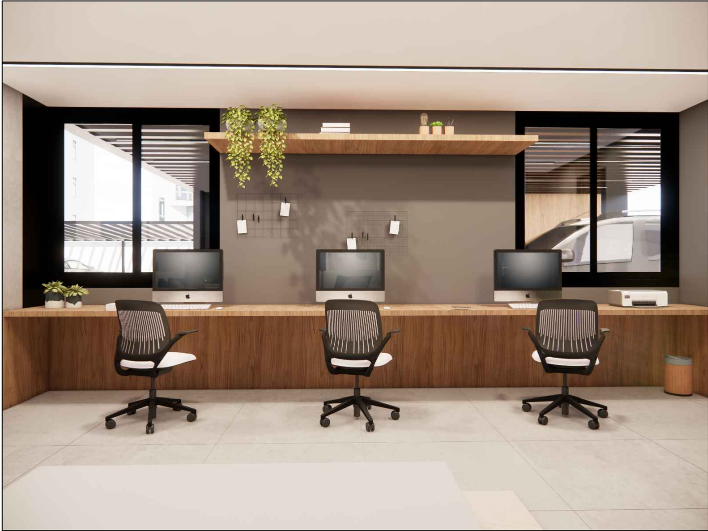
**IMAGENS ILUSTRATIVAS - SALA MOTORISTA